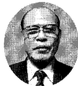
社会福祉法人 城東区社会福祉協議会