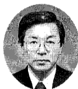
平素は、市政・区政の理解とご協力を賜り、厚くお礼申し上げます。

また、社会福祉協議会を始め、各種団体の皆様方が心ふれあう住みよい町づくりを目指す活発なご活動を重ねていただき