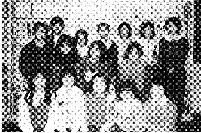
図書館に集まった子どもたち